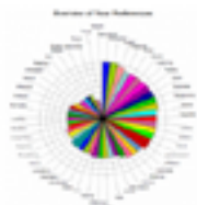
IC – Identity Compass